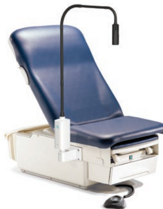
Support pour table