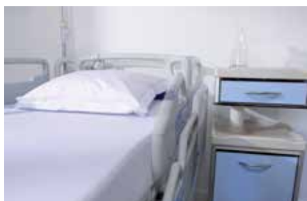
Le rail de verrouillage n'occupe que 4 cm sur le côté du lit