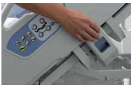
Déverrouillage du rail d'une seule main