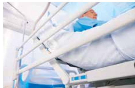
L'indicateur Line-Of-Site facilite le positionnement du patient