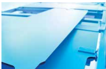
Les panneaux du plan de couchage faciles à nettoyer contribuent à une plus grande hygiène