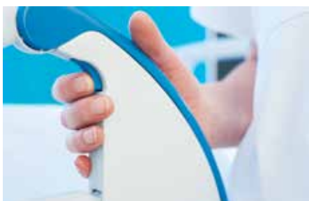
Le double verrouillage accroît la sécurité