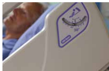
Indicateurs d'angle facile à lire